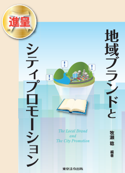
『地域ブランドとシティプロモーション』