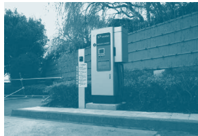
衝突防止措置（車止めやポストコーン等の設置）