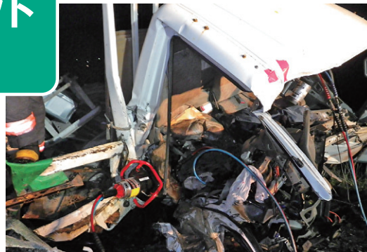
写真2-1 2tシングルキャビントラックの状況